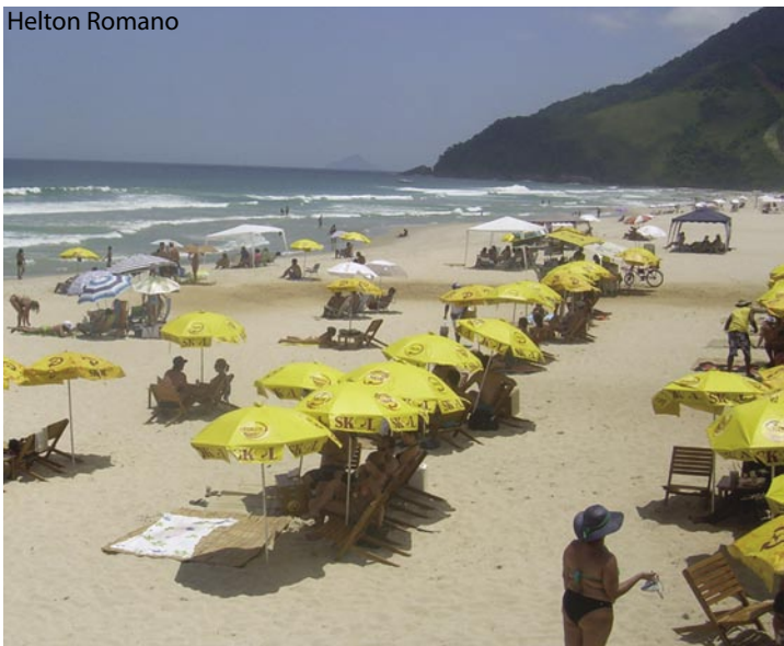
Cadeiras e guarda-sóis de um bar em Maresias

PH entende que disponibilizar cadeiras e guarda-sóis é uma maneira de oferecer comodidade aos turistas. “Não acho que isto deva ser proibido. O que a gente quer é coibir abusos e estabelecer um ordenamento para que todos possam usufruir da praia”, defende PH.