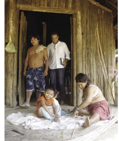
Visita à aldeia Ribeirão Silveira