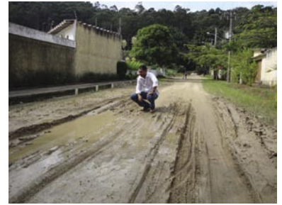
Estado precário de rua enlameada no bairro de Boracéia