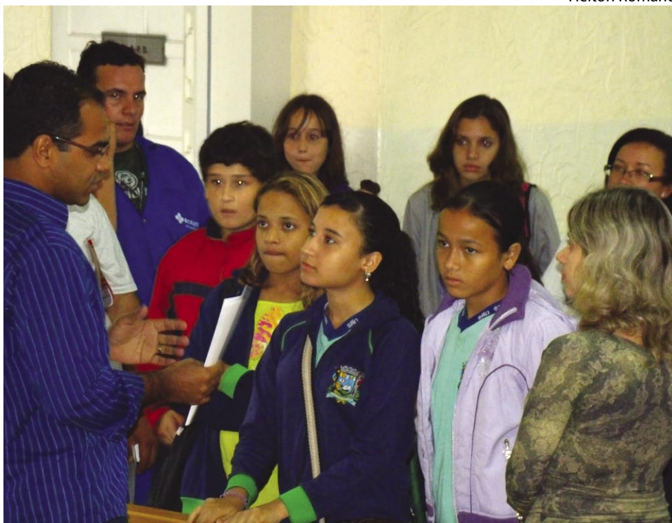
PH esclarece dúvidas de alunos durante visita à Câmara

Após o encerramento oficial, os alunos não se deram por satisfeitos, e aproveitaram a aproximação do vereador PH para demonstrar que estão atentos aos problemas da cidade.