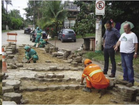
Calçamento destruído na Travessa Onofre Santos, no Olaria (à esquerda); PH fiscaliza recolocação de bloquetes em Barra do Sahy (acima)