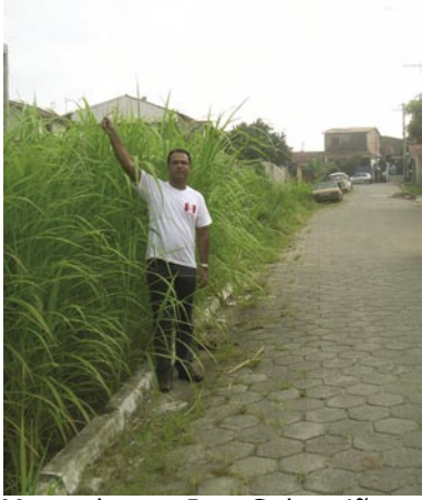
Mato alto na Rua Sebastião Pereira da Silva, bairro do São Francisco