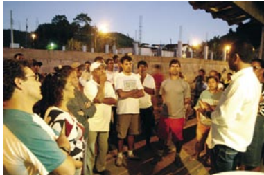
PH conversa com moradores da Vila Barreira, em Cambury