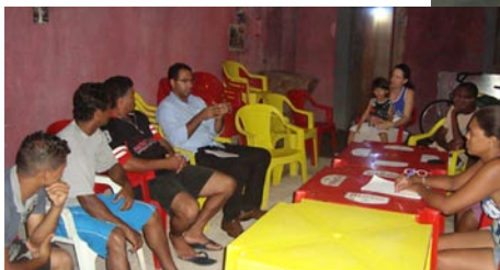
Reunido com moradores do Sítio Velho, em Barra do Una