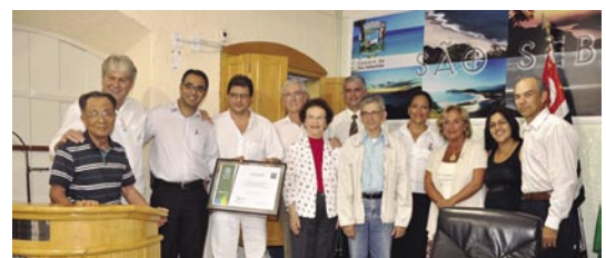
PH entrega moção de Aplausos e Reconhecimento ao Rotary Clube de São Sebastião