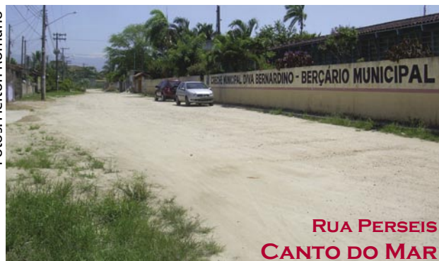
RUA PERSEIS CANTO DO MAR