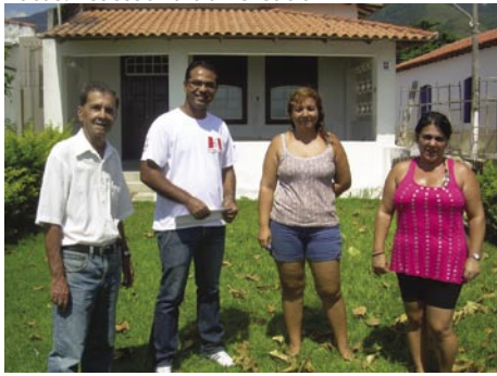
Ao lado do presidente e de voluntárias da Colônia de Pesca