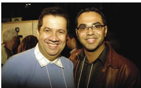
Ministro do Trabalho e presidente nacional do PDT, Carlos Lupi