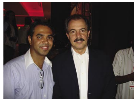
Ministro de Ciência e Tecnologia, Aloizio Mercadante