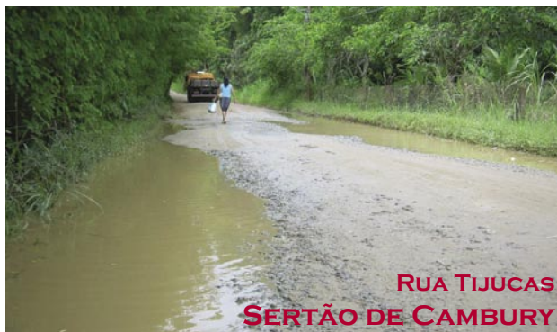
RUA TIJUCAS SERTÃO DE CAMBURY