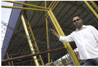
Portões danificados na quadra de Barequeçaba