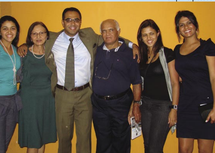
PH ao lado dos pais, irmãs e esposa