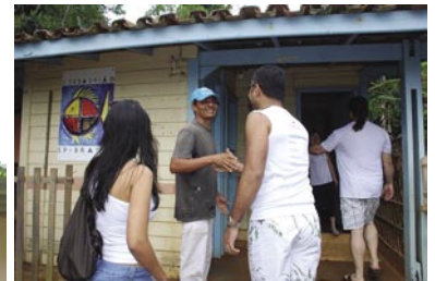
Visita à escola da Ilha Montão de Trigo