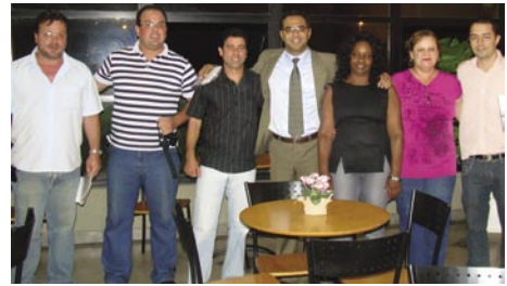
Equipe de assessores de PH