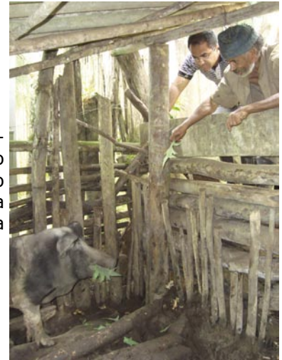
Visita ao eremita que vive no alto do morro da Estrada da Limeira