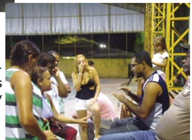
PH esclarece dúvidas de moradores de Juquehy