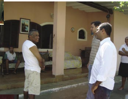
Visita à instituição Vida Nova, entidade que abriga e recupera dependentes químicos