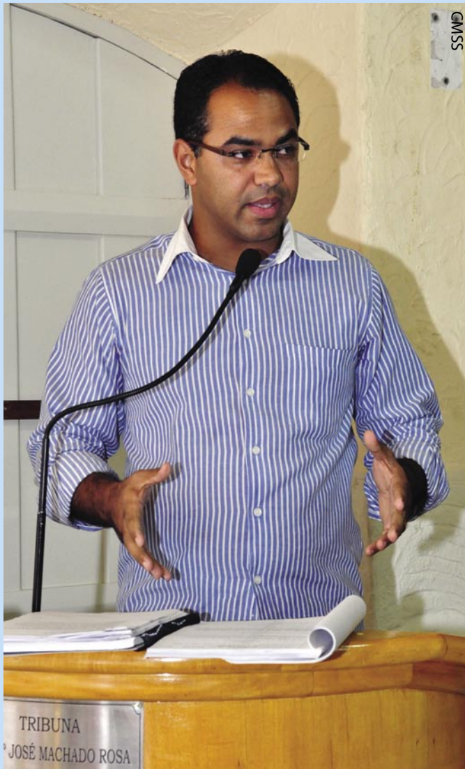
PH na tribuna da Câmara durante sessão

Com esse espírito de liderança que PH entrou para a política. Antes, em 1998, passou no concurso público da Prefeitura para o cargo de inspetor de alunos. Conciliou o trabalho com o curso da faculdade de Direito em Mogi das Cruzes e foi aprovado no exame da Ordem dos Advogados do