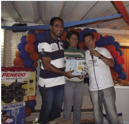
Entregando brindes na festa dos Servidores Públicos